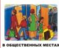
В ОБЩЕСТВЕННЫХ МЕСТАХ