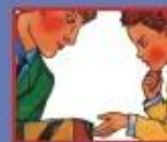
В ТРАНСПОРТЕ- РОДИТЕЛЮ