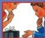
В МАГАЗИНЕ- ПРОДАВЦУ