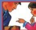
НА УЛИЦЕ ИЛИ В МЕТРО- ПОЛИЦЕЙСКОМУ